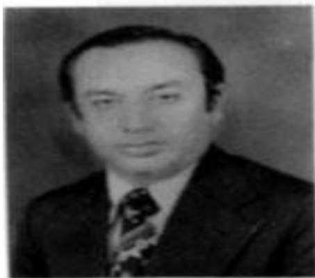
قاضي محمد اعظم